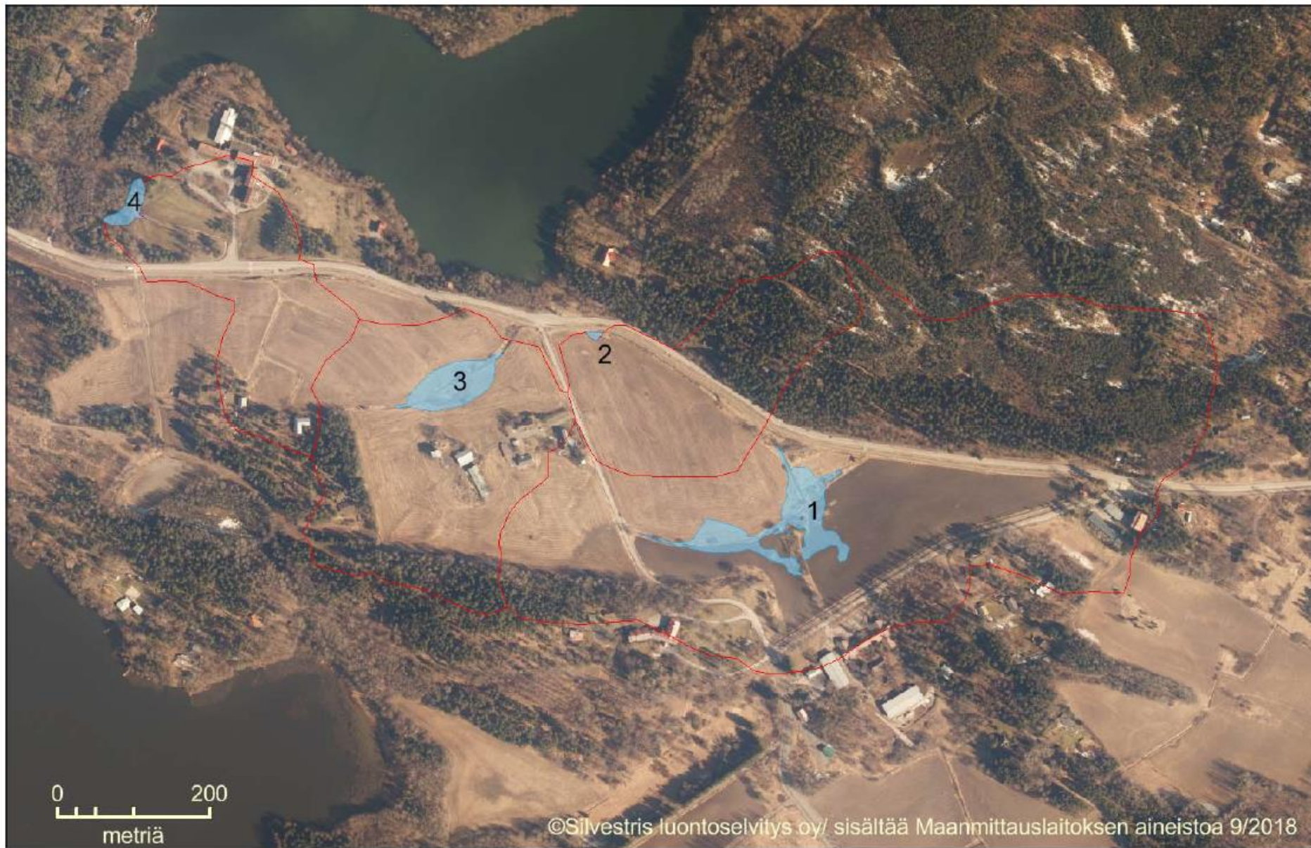
Kuva 1. Alustavat kosteikot ilmakuvapohjalla, valuma-alueiden rajat punaisella